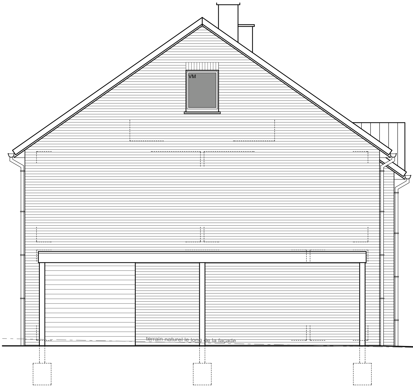
VIVEGNIS - rue d'Abooz MAISON 38 - PIGNON