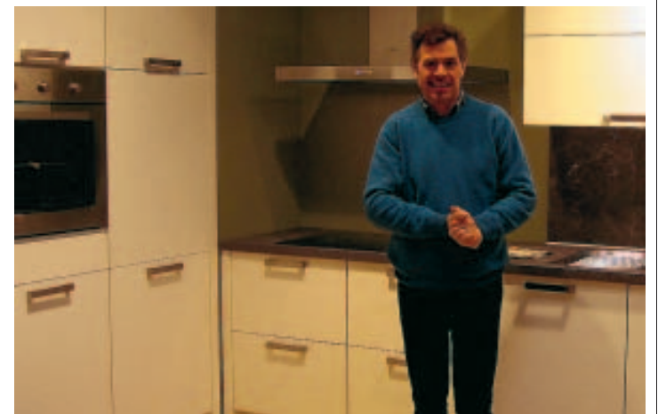
Les cuisinistes se frottent les mains pendant le salon.