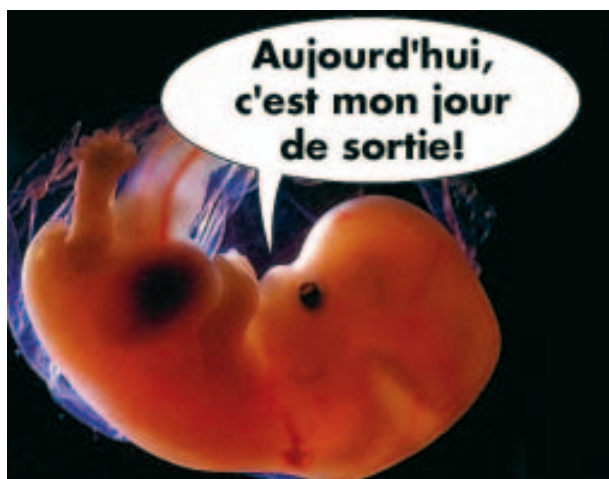
Signée Charles Richard (de Vottem)

Chaque jour, gagnez un cadeau surprise. Découpez ou scannez n'importe quelle photo parue récemment et proposez-nous une bulle la plus drôle possible. Envoyez-nous l'ensemble + vos coordonnées à La Meuse, bd de la Sauvenière, 38 à 4000 Liège ou à concours.lameuse@sudpresse.be